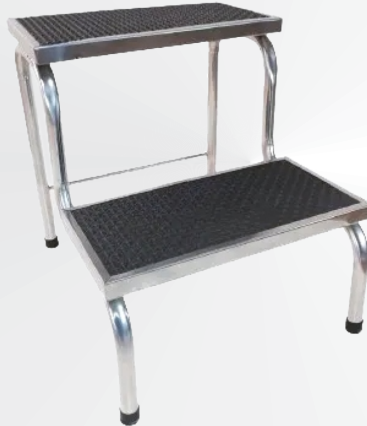
Escada 2 Degraus