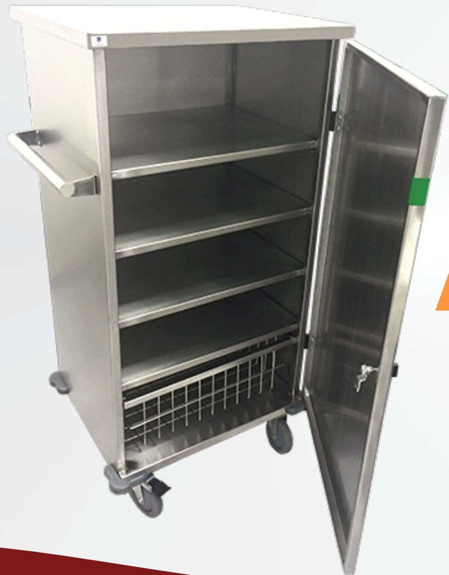
Carro Material Esterelizado