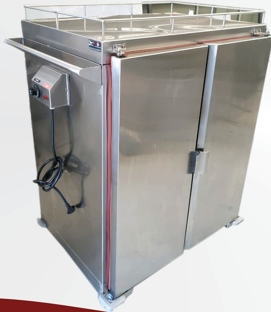
Carro Transporte Alimentos