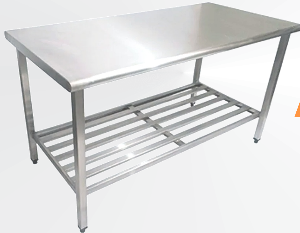
Mesa com Tampo Inferior