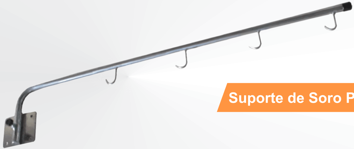
Suporte de Soro Parede