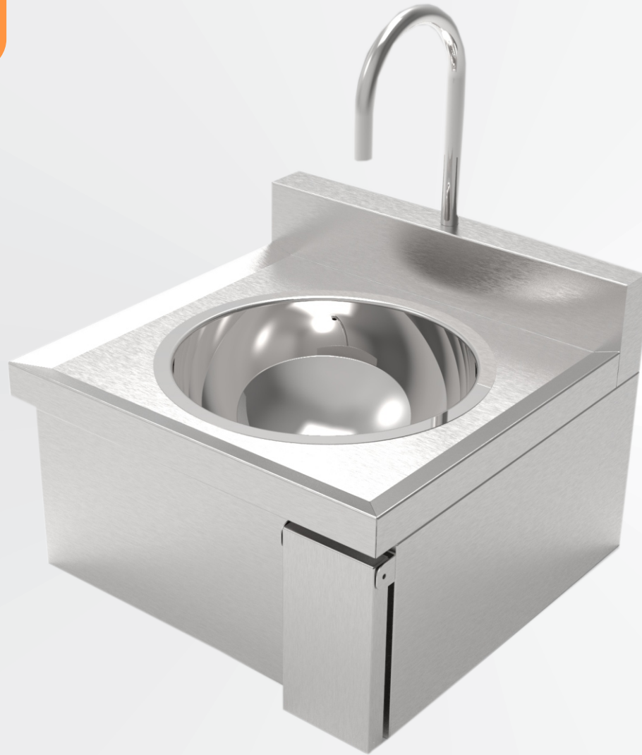
Lavatório de Assepsia Joelho